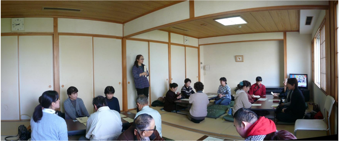
交流会の流れ等説明を受ける参加者

昼食の弁当に味噌汁(きのこ汁)も付けて貰って美味しく食べました、又 昼食後は参加者全員に受付の時、入浴券を貰ったので、早速温泉を利用する参加者もいました。