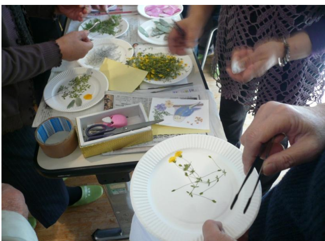
押し花教室の材料選び1