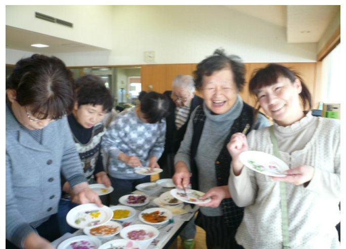
押し花教室の材料選び2