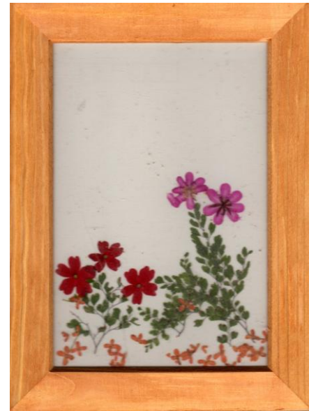
押し花作品3作品(ポートフレームへ入れました)