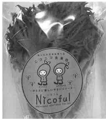
機能性野菜「低カリウム野菜」

がっていただけの野菜を提供する「地域社会循環型」の低カリウム事業を目指しています。そして、この事業が障がい者主体で経営可能であるということを実証出来れば、全国各地の障がいのある方々の就労の輪が広がるものと確信しています。