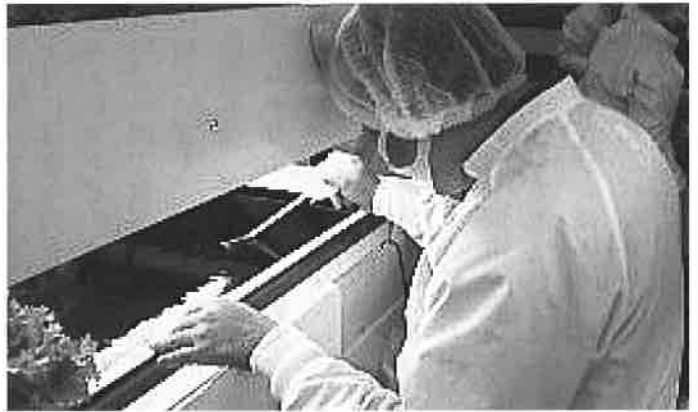
慎重に作業へとりこんでます

参りました。その後、第2期計画として、農業県山形との共存と地域に暮す障がい者との共生を念頭に、地域の農業生産者と競合せず、共栄可能な道筋を探り、平成25年12月全国では3番目、障がい者主体による事業としては、全国初となる機能性野菜「低カリウム野菜」の量産化事業を開始しました。当事業所に集う障がいのある社員が地域に暮らし、機能性障がいでも食べたくても食べることを出来ない方々に安心して、召し上