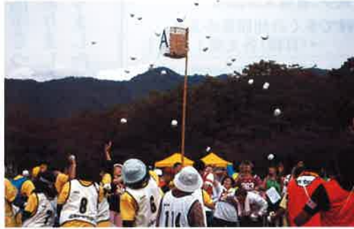
かごめがけて いっぱい玉入れ

計1296名でした。例年並みの参加人数でした。秋空のもと、広い運動場が元氣いっぱい走りまわることができました。また、年に一度の事業所同士交流も行うことができました。