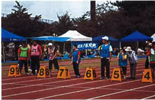
緊張して50メートル走の出発準備