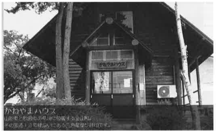
「かねやまハウス」ログハウス型建物

ス」と合併し「特定非営利活動法人すぎのこはうす・かねやまハウス」となり再スタートを切りました。生活介護と就労継続支援B型を行っています。ログハウス型の建物で、杉の町金山にマッチした落ち着いた雰囲気醸し出しています。現在利用者八名、スタッフ三名でアットホームな中で日々作業をしています。主に菓子作り、リサイクル作業、外注内職作業で収入を得ています。菓子販売は地元を中心とした店舗に置いていただいたり、各種イベントには積極的に参加しています。また、リサイクル作業では町内の方々が、缶やペットボトル等をたくさん持ってきてくれます。地元の方々に愛され、見守られながら、地元密着型の事業所となっています。設立当初のスローガン「社会参加と自立をめざして」が達成されていると思っています。みんなが毎日楽しく、やりがいの持てる事業所をこれからも継続していきます。