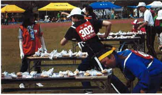
口にくわえて パン食い競争

9月17日(水)、第13回山形県知的しょうがい者レクリエーション大会が、山形県運動公園サブグラウンドで行われました。暑くもなく、寒くもなく絶好の運動日和に恵まれました。フィールド競技、トラック競技、団体競技の13種目に力いっぱい汗した大会になりました。応援賞は、友愛園(新庄市)、最上ふれあい学園(最上町)の二団体に授与されました。なかなか趣向をこらした応援だったことが評価されました。