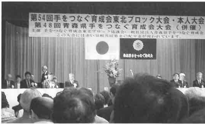
東北ブロック大会第1目式典会場

大会2日目は、3つの育成分科会と3つの本人分科会において、各テーマに基づき熱心な討議を行いました。